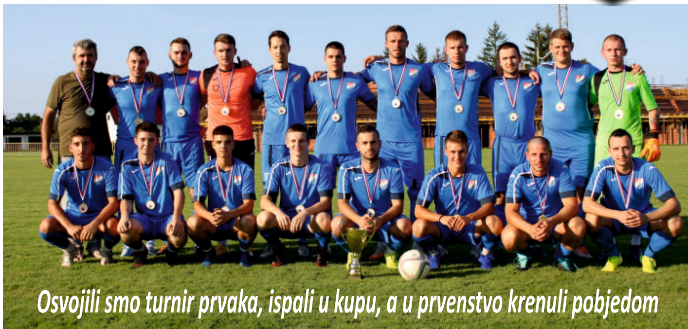
Osvajili smo turnir prvaka, ispali u kupu, a u prvenstvo krenuli pobjedom